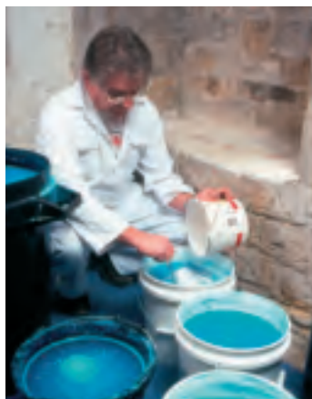
Een schilder bereidt op verzoek en in samenspraak met de kleuronderzoeker een historisch receptuur voor de kleur verdigris

De Rijksdienst en lokale overheden kunnen de gemaakte afspraken erkennen en benutten en hiermee de kwaliteit van de restauratie verder beheersbaar te maken. Dit kan door bij het verlenen van opdrachten, subsidies, beschikkingen en vergunningen de afspraken als voorwaarden op te nemen. Maar dan zullen de afspraken eerst “officieel” gemaakt moeten worden en gedragen door alle partijen in het werkveld van restauratie van schilderijen en restauratieschilderwerk. 🐼