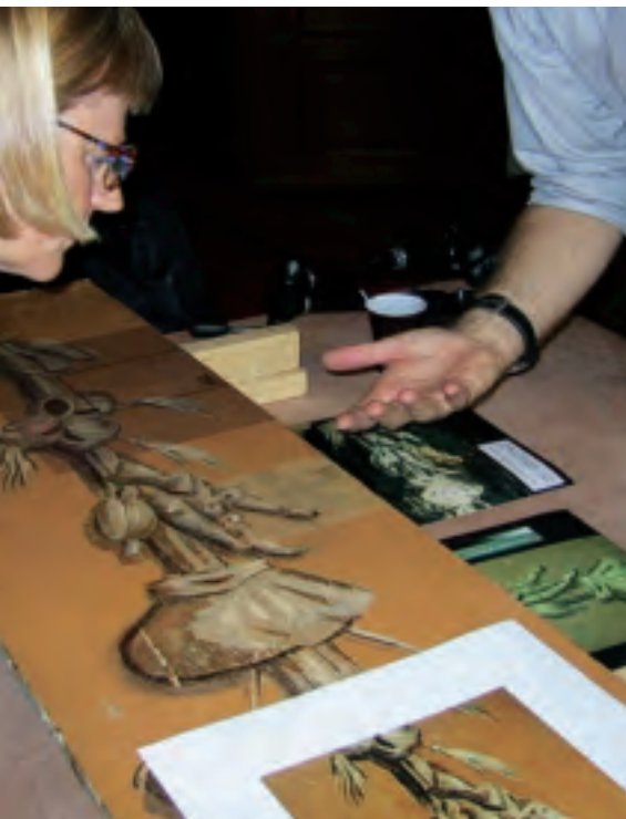
Restauratoren buigen zich over een gedemonteerde betimmering met 17de eeuws schilderwerk (Amsterdams Trappenhuis).