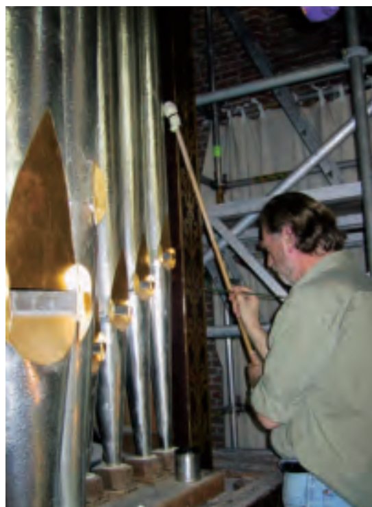
Een restauratieschilder schildert een nieuwe decoratieve schildering naar voorbeeld van oude vondsten blootgelegd door een kleuronderzoeker/restaurator (Leiden, Pieterskerk, Van Hagerbeerorgel).

woordelijkheid over het eigen aandeel in behandelingen en ingrepen en past uit zijn/haar repertoire methoden en technieken toe. De kleuronderzoeker/restaurator heeft integrale eindverantwoordelijkheid/supervisie over behandelingen en ingrepen en over de keuze van methoden en technieken. Hij/zij verricht onderzoek, maakt afwegingen, neemt beslissingen en doet voorstellen voor behandeling. De aanpak van de restauratieschilder is objectgericht, sterk ambachtelijk en daarbinnen analytisch. De aanpak van de kleuronderzoeker/restaurator is contextgericht, breed analytisch en daarnaast ambachtelijk.