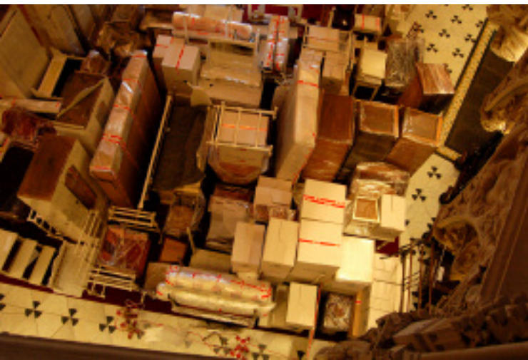
6 De Main Hall van bovenaf gezien. De hal staat helemaal vol met objecten en dozen, die klaar staan voor vervoer. De rondleiders moesten hun groepen hier tussendoor manoevreren.

Kasteel de Haar heeft altijd een vrij stringente evenementen-agenda, waarin al een jaar van tevoren vast ligt wanneer fairs, evenementen maar ook bijvoorbeeld werkzaamheden in park en tuinen plaatsvinden. Daarom maakt de organisatie in overleg met de derde partijen als Helicon en de bouw vooraf afspraken wanneer er wel en niet gewerkt kan worden. Dat gaat over het algemeen goed, al is het soms een heel gepuzzel om 'de niet werkbare dagen' af te stemmen op de bouw- en uithuisplanning. En natuur-