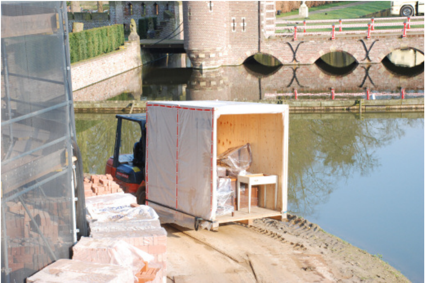
2 De objecten werden voor de hoofdingang in een voor het project gemaakte transportcontainer geladen, waarna deze door een heftruck over de gedempte gracht naar de vrachtwagen werd gereden. Daar werden de objecten overgeladen.

van de objecten. Omdat het Kasteel open zou blijven voor bezoek en rondleidingen interessant moesten blijven is besloten om de uithuizing in twee delen te splitsen.