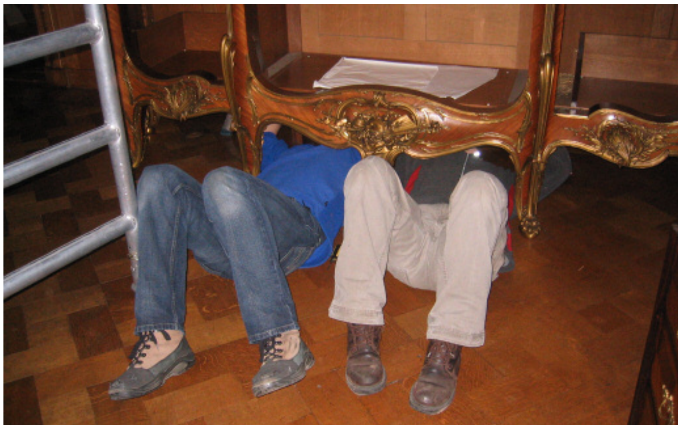
1 Een aantal grote meubels zoals deze kast moest worden gedemonteerd om vervoerd te kunnen worden. Dit werd uitgevoerd onder leiding van meubelrestaurator Arjen Eissens.